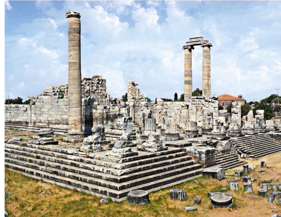
>> Tempio di Apollo, 332-331 e 300 a.C. ca. Dídyma (presso Mileto, Turchia).