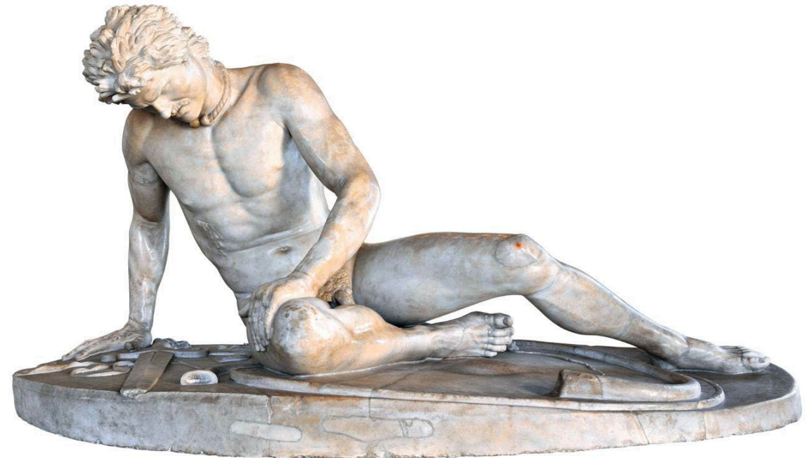
>> Epigono, Gàlata morente , 60-40 a.C., copia romana da un originale bronzeo del 230-220 a.C. Marmo, h. 93 cm. Roma, Musei Capitolini, Palazzo Nuovo.