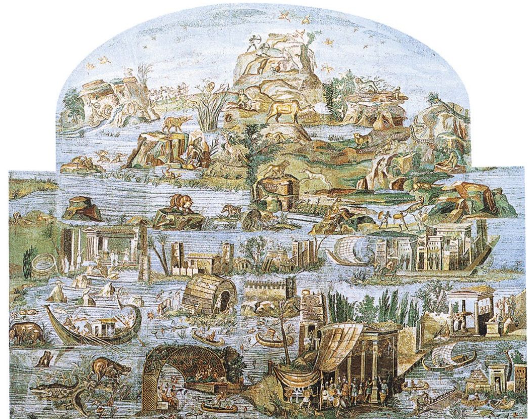
>> Mosaico del Nilo , dal Santuario della Fortuna Primigenia, fine del primo ventennio del I sec. a.C. 615x506 cm. Palestrina (Roma), Museo Archeologico Prenestino.