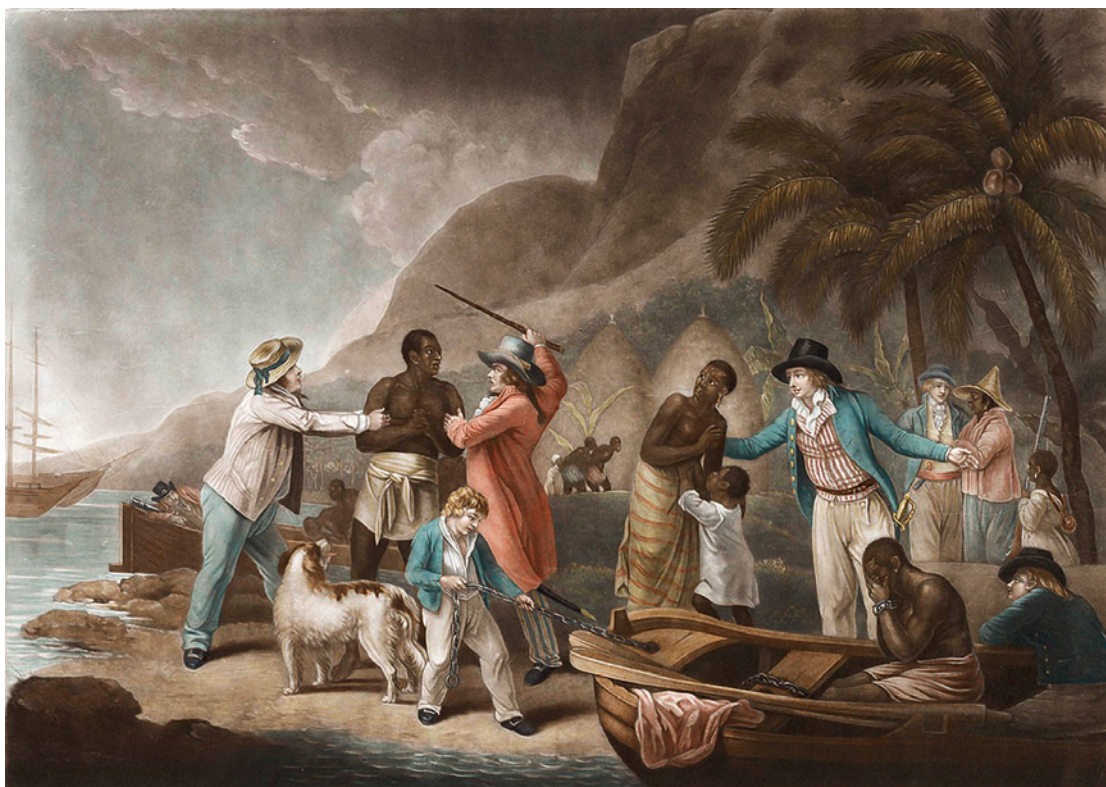
G. Moreland, Un esecrabile traffico di uomini, 1788.