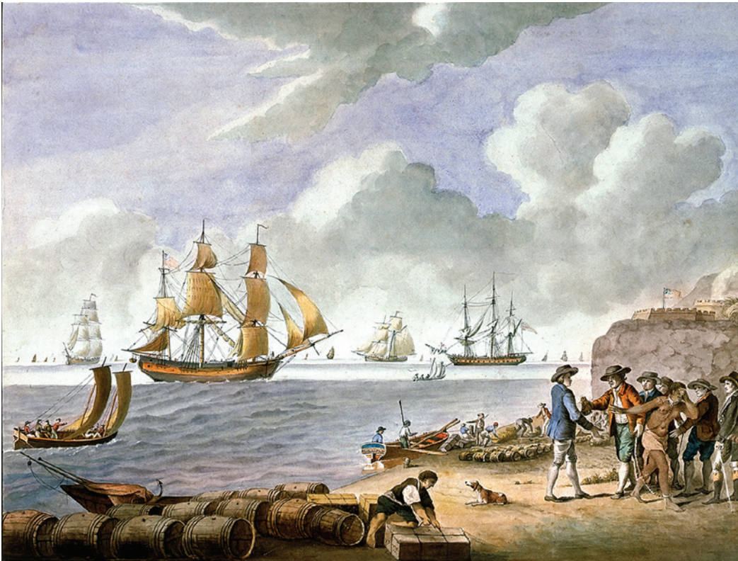
S. Hutchinson, Vendita di una schiava, 1793.

Per quanto riguarda il divieto posto al commercio degli schiavi, se i primi passi furono compiuti dai singoli Paesi intervenendo sul proprio ordinamento giuridico ( diritto interno ), presto si avvertì l'esigenza di agire sul piano degli accordi fra Stati , vista la dimensione internazionale del traffico che si svolgeva lungo le rotte marittime.