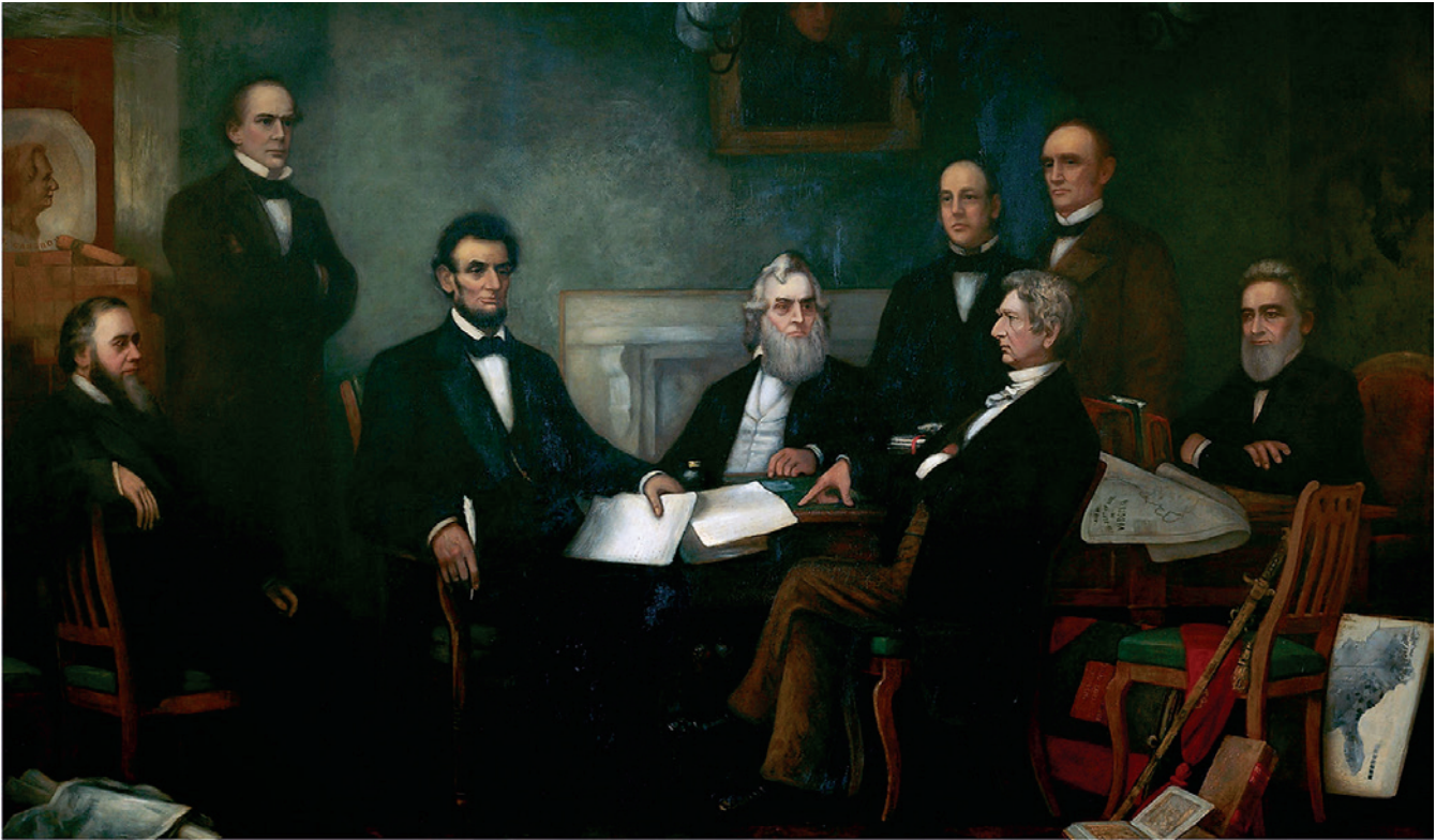
F. B. Carpenter, Lincoln legge il Proclama di Emancipazione ai suoi collaboratori (22 luglio 1862), 1864.