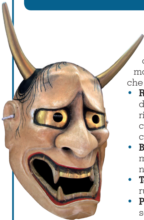
Maschera del Teatro Noh, Giappone.