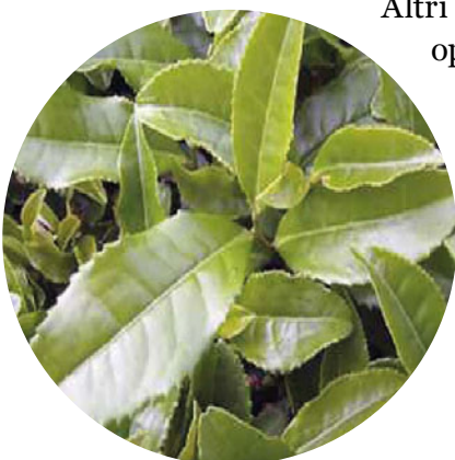
Foglie della Pianta del tè.

Molti farmaci sono di origine vegetale e molte piante, soprattutto di origine tropicale, dove è massima la biodiversità, sono molto studiate per la ricerca di nuovi o più efficaci agenti terapeutici.