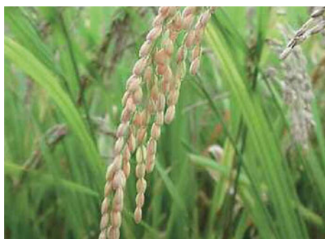
Pianta del riso

Le radici e i fusti sotterranei (tuberi) sono solitamente molto ricchi di amido, come nel caso delle patate, e ciò li rende alimenti ideali per fornire i carboidrati per la dieta di milioni di persone.