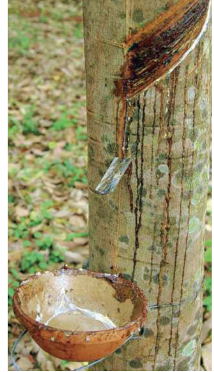
Pianta della gomma.

La maggior parte dello zucchero consumato nel mondo è fornito da due piante: la canna da zucchero (graminacea), e la barbabietola da zucchero strettamente affine alla barbabietola da orto. Gli ortaggi o verdure sono importanti fonti di vitamine e sostanze minerali necessarie per una corretta alimentazione. Molti ortaggi in realtà sono dei frutti: pomodoro, peperone, zucca e cetriolo. Nelle zone temperate l' albero da frutto più coltivato è il melo. Esso appartiene alla famiglia delle Rosaceae che comprende altre specie da frutto molto importanti come il pero, il susino, il pesco, il ciliegio, l'albicocco.