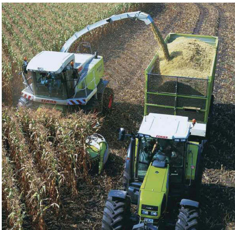
Campo di mais