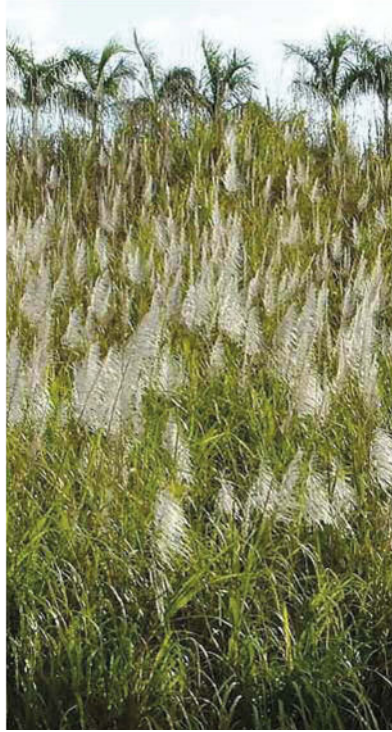
Piantazione di canna da zucchero.